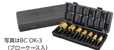
写真はBC DK-3 (ブローケース入)