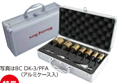
写真はBC DK-3/PFA (アルミケース入)