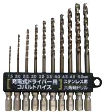
PS902 ステンレス、鉄工、 金属などの穴あけに！