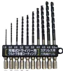
PS599 ステンレス、鉄工、 金属などの穴あけに！