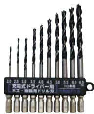
PS808 木材、樹脂の穴あけに！