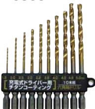
PS900 鉄工、軽金属の穴あけに 木材、樹脂の穴あけに！