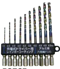
PS597 アルミ、軽金属、 銅などの穴あけに！