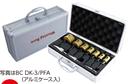
写真はBC DK-3/PFA (アルミケース入)