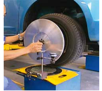
◆オプション部品のダイヤルゲージを用いて手動ランナウト補正を行っている様子。

◆測定ディスクの振れを確認し、その誤差を0.3mm以下に整える作業です。ホイールの角度のすべてがこの測定ディスクに0.3mm以下の精度で現れます。