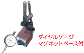
ダイヤルゲージ マグネットベース付

◆測定車と床面の間には、車高の低い車を乗り上げ、ジャッキアップしやすいよう、スロープ台と、車体の下に入って調整がしやすいワーキング台にて、車体をセットすると、測定調整がしやすい。ホイールアライメントをしない時は、フロアを別利用できます。