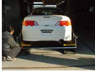
◆測定バーの後端と前端を測定している様子。長方形の状態を確認。