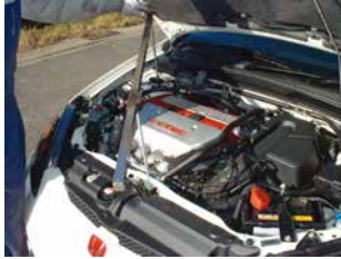
◆車のセンターよりダンパーハウジングの位置を測定している様子。