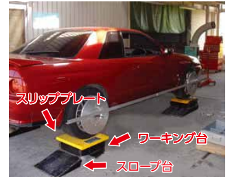
スリッププレート ワーキング台 スロープ台

◆測定車と床面の間には、車高の低い車を乗り上げ、ジャッキアップしやすいよう、スロープ台と、車体の下に入って調整がしやすいワーキング台にて、車体をセットすると、測定調整がしやすい。ホイールアライメントをしない時は、フロアを別利用できます。