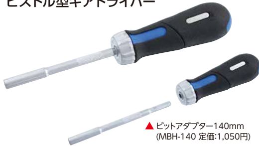
▲ビットアダプター140mm (MBH-140 定価:1,050円)