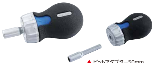
▲ビットアダプター50mm (MBH-50 定価:530円)